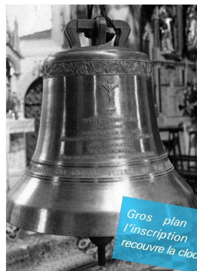
Gros plan sur l'inscription qui recouvre la cloche

Suite à l'article paru dans le précédent numéro de CLARTE, nous avons retrouvé deux photos du baptême de la « Cloche Marie-Geneviève ».