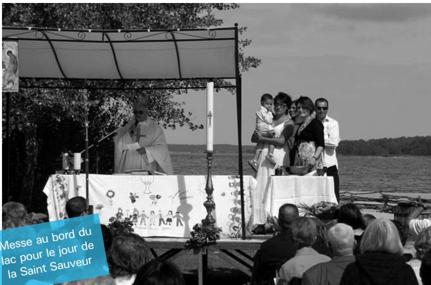
Messe au bord du lac pour le jour de la Saint Sauveur

Le dimanche de la Saint Sauveur, c'est la fête à Sanguinet. Depuis l'année dernière, nous avons pris l'initiative de commémorer la Saint Sauveur, en plein air, au bord du lac. Cette année encore, les paroissiens habituels, ceux des communes voisines ou tout simplement ceux venus en vacances sont venus assister à l'office célébré par le Père Lestage. Même le soleil était au rendez-vous. Le groupe "GAG" musiciens et chanteurs, ont, par leur talent et leur conviction, contribué à donner à cette assemblée une ferveur différente, en étant toute aussi recueillie. Un adorable petit garçon fut baptisé au cours de cette messe. Moments émouvants pour tous, que de voir cet