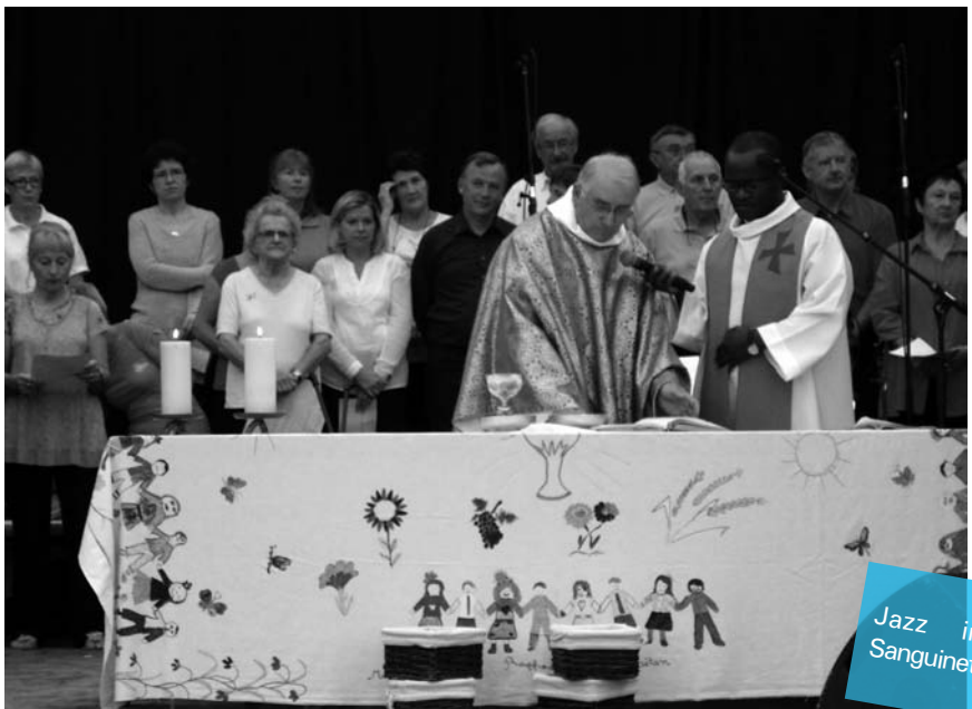
Jazz in Sanguinet

enfant entrer dans la Grande Famille des Chrétiens. Autre moment fort de cette matinée : la Bénédiction des bateaux sur les eaux limpides du lac. N'oublions pas le pot de l'Amitié, servi traditionnellement dans toutes ces occasions et qui permet de faire de ce rassemblement, un véritable succès. A L'année prochaine.